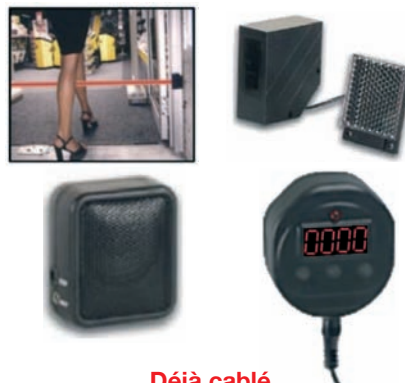
V Déjà câblé prêt à être installé 407VE - Détection d'entrée Infra Rouge - Haut-parleur carillon-alarme / Volume réglable - Durée audio réglable / Délai d'activation réglable - Capteur photoélectrique IR avec réflecteur 7 m - Livré avec fixations et adaptateur 220VAC / 9VDC - D : 160x95x85 mm / 700 g - Compteur de passage 407VE/CPT en option 407VE/CPT - Compteur de passage (option) - Compteur 4 digits / RAZ inclus / Câble 10 m - Opération manuelle comptant ou décomptant - D : 160x10x45 mm / 250 g