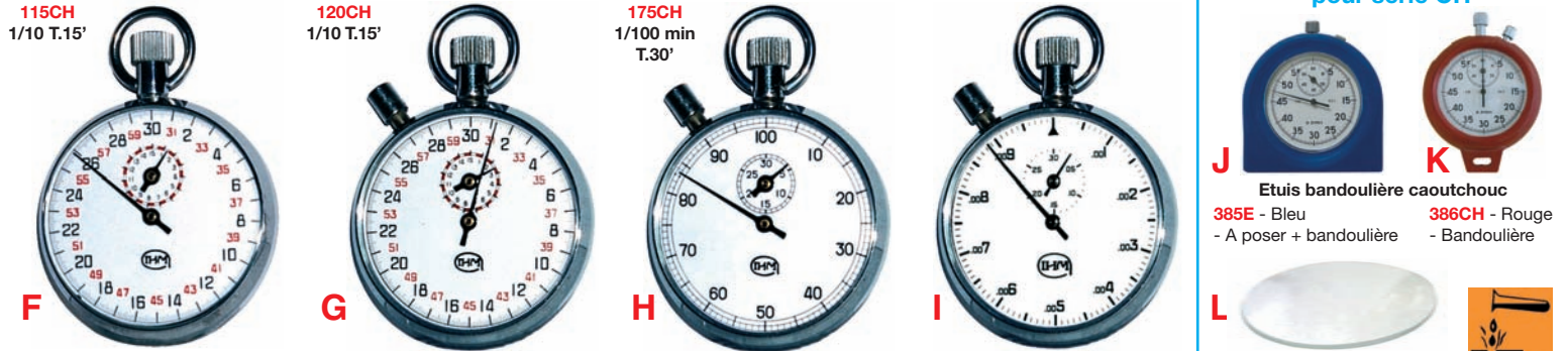
115CH 1/10 T.15'