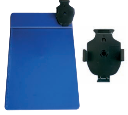
W 379BR - Planchette seule 380BR - Planchette de chronométrage et d'entraînement - Plaquette ABS réversible - Livrée avec pince 301Q - D : 345x235x3 mm