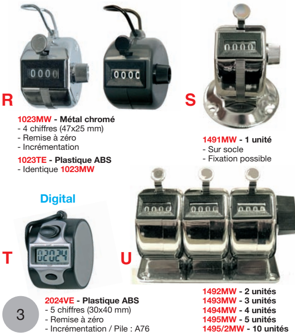
R 1023MW - Métal chromé - 4 chiffres (47x25 mm) - Remise à zéro - Incrémentation 1023TE - Plastique ABS - Identique 1023MW